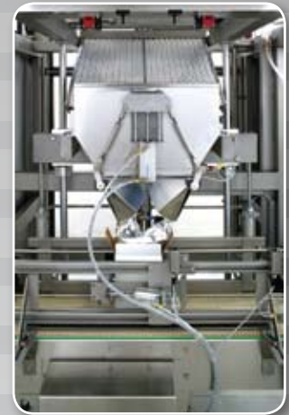
Riempritrice automatica di sacchi completa di inserimento nel cartone

Formeuse de cartons automatique avec fermeture inférieure par colle à chaud.