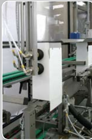
Formatrice di cartone automatica con chiusura inferiore tramite colla caldo

Amortisseur à air pour la stabilisation de la pression du produit d'alimentation (pour limiter les chocs lors du remplissage). Il est complet avec valve pour le lavage intérieur du réservoir principal.